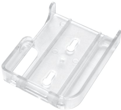
Support de fixation murale