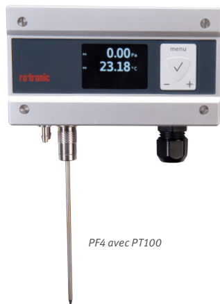
PF4 avec PT100