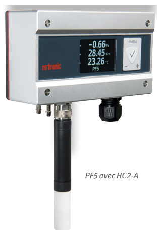
PF5 avec HC2-A